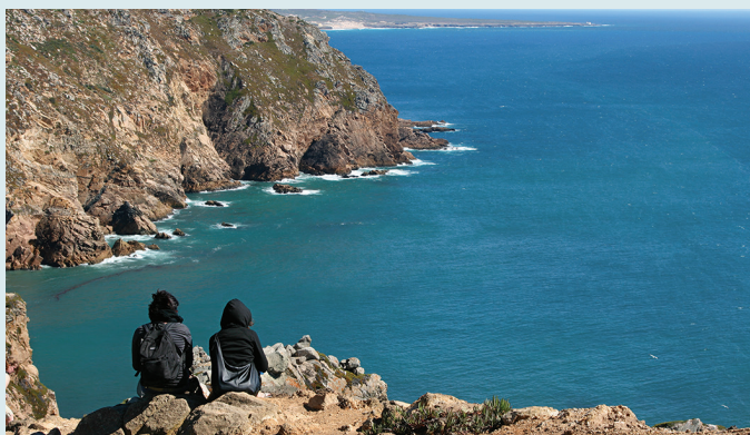
Widok na Costa Vicentina

Spędź sobotni poranek na targu w Loulé – spotykają się tu lokalni rolnicy sprzedający warzywa ze swoich ogródków. Na straganach ustawionych w pięknej neomauretańskiej hali można kupić ekologiczne owoce i warzywa, a także świeże ryby! Zob. s. 43 i s. 97.