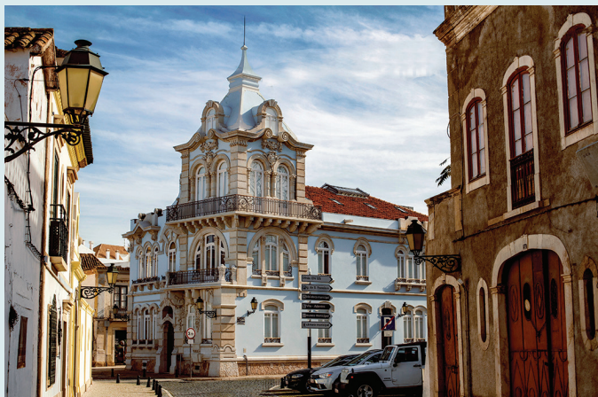
Palacete Belmarço na starym mieście w Faro

Spotkaj się z oceanem na wybrzeżu Costa Vicentina w okolicy Arrifana lub Carrapateira – dwóch miejscowości, do których najczęściej przybywają surferzy zwiabieni najwyższymi falami. W zachodniej części Algarve, w otoczeniu dzikich, zapierających dech w piersiach krajobrazów czekają cię pełne adrenaliny przeżycia. Zob. s. 47 i s. 123.